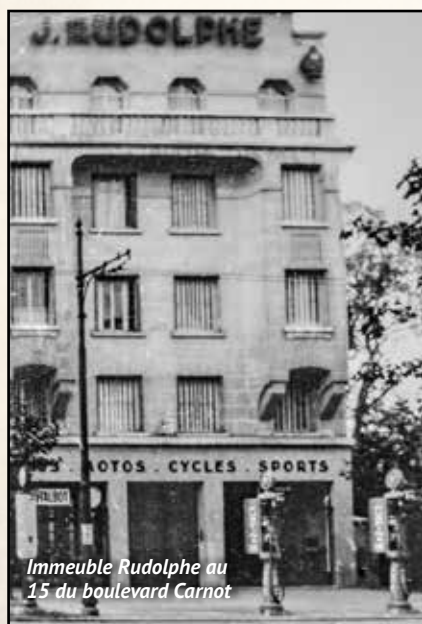
Immeuble Rudolphe au 15 du boulevard Carnot